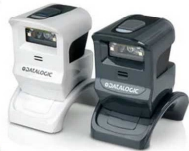
دستگاه اسکن کدهای QR

افزایش قابلیت اطمینان و جلوگیری از تولید کدهای هرز