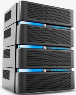
سرور ابری یا اختصاصی